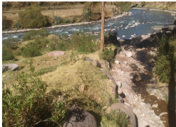
FOTO 04: Se Aprecia la entrega del cauce al rio Salca, que la quebrada Cachimayo que al pie de talud es de talud natural, localidad Jayubamba del distrito de Combapata.