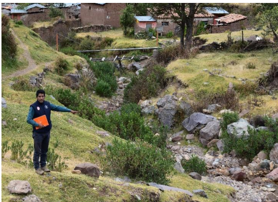
FOTO 01: Se Aprecia el cauce con pendiente muy fuerte, por la margen derecha e izquierda se encuentra asentado viviendas.