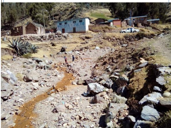
FOTO 03: Se aprecia el pircado con piedra mediana en la margen izquierda, requiriendo, descolmatación y protección de la s riberas para vitar la erosión y